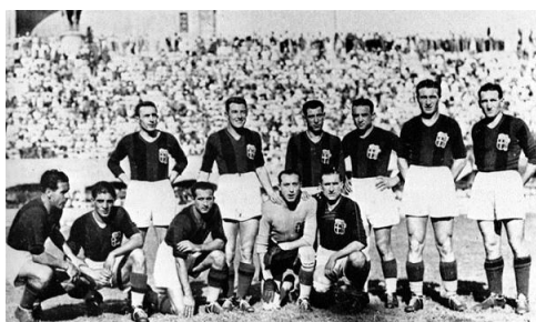
La squadra del Bologna vincitrice dello scudetto 1936-1937

Oggi, molti giovani europei sono attratti da Barcellona e desiderano andare a viverci o trascorrere qualche anno in questa città così "cool". Tra i motivi c'è senza dubbio la squadra di calcio, che vince coppe e campionati ed è accompagnata da un'immagine positiva e brillante. Non a caso, tra i souvenir più acquistati da chi si reca nella capitale catalana c'è la maglietta "blaugrana". Negli anni tra le due guerre mondiali, l'equivalente italiano del Barcellona era il Bologna. Migliaia di studenti d'ogni parte d'Italia si recavano a studiare nella città emiliana non solo per il prestigio dell'università, ma anche per la locale squadra di football, che vinceva e dava spettacolo. Era il famoso Bologna " che tremare il mondo fa ", ai vertici italiani ed europei.