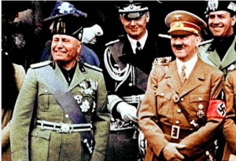
Mussolini e Hitler durante la visita di quest'ultimo a Roma nel 1938

Ma, nel frattempo, altro sta accadendo fuori dai campi di football. Quel 1937 è anche l'anno XV dell'era fascista , cominciata nel 1922 con l'avvento al potere di Mussolini. Lo stadio bolognese, teatro delle gesta della squadra di Weisz, si chiama "Stadio Littoriale" e vi campeggia un'enorme statua equestre del Duce, che l'ha inaugurato personalmente il 31 ottobre 1926 (nel pomeriggio dello stesso giorno Mussolini uscì illeso da un attentato nel centro cittadino, NdA). Il fascismo è dunque una presenza stabile nella quotidianità dell'Italia e di Weisz. Tuttavia, nonostante le violenze, le violazioni dei diritti, i soprusi generalizzati, il fascismo sembra non minacciare la vita e la felicità sua e della sua famiglia.