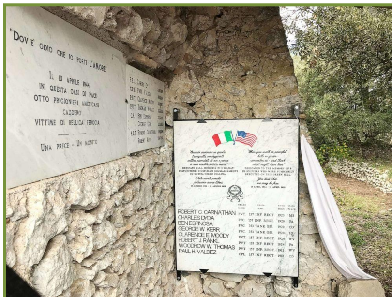
Lapide in onore dei Caduti - Eremo di Montebuono